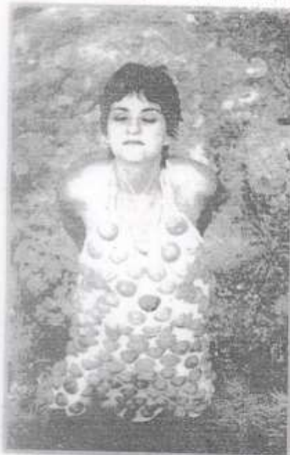
Vestido de media maraña